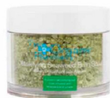
Stimuleert de bloedsomloop en ontgift Detoxifying Seaweed Bath Soak € 45 The Organic Pharmacy, via Babassu