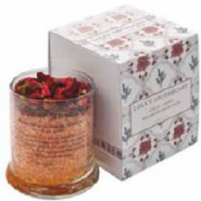
Met rozen, zoete sinaasappel en geranium Delicate Romance Balancing Bath Salts € 69 Lola's Apothecary, via Babassu