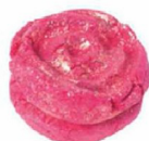
Laat je rozig voelen Rose Jam Bubbleroon € 8 LUSH